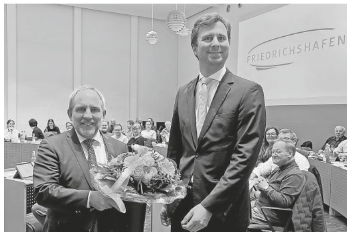
Oberbürgermeister Simon Blümcke gratuliert Andreas Hein zur Wahl zum Ersten Bürgermeister der Stadt Friedrichshafen.

Weitere Informationen und alle Vorlagen zu den aktuellen öffentlichen Sitzungen des Gemeinderates und der Ausschüsse sind unter www.sitzungsdienst.friedrichshafen.de zu finden.